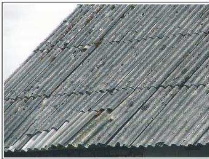
Fot.1 Pokrycie dachowe budynku gospodarczego z płyt falistych - I stopień pilności

ZAŁĄCZNIK 2: Dokumentacja fotograficzna (przykłady pokryć dachowych o różnym stopniu uszkodzeń poszycia).