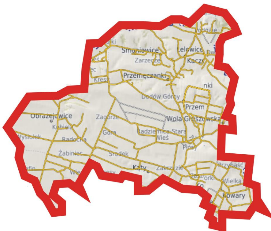
Rys 1. Mapa gminy Radziemice