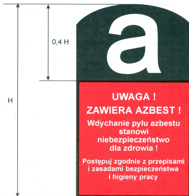
Rys.2. Wzór etykiety do oznakowania wyrobów i odpadów zawierających azbest, zgodnie z załącznikiem do Rozporządzenia Ministra Gospodarki, Pracy i Polityki Społecznej z dnia 2 kwietnia 2004 r. w sprawie sposobów i warunków bezpiecznego użytkowania i usuwania wyrobów zawierających azbest.

Przy pracach związanych z usuwaniem azbestu i wyrobów azbestowych pracownicy powinni stosować wydzielone narzędzia i sprzęt ochronny. W strefie prowadzonych prac obowiązuje zakaz palenia tytoniu i spożywania posiłków. Ubrania ochronne należy przechowywać w wydzielonych miejscach. Nie wolno ich wynosić oraz pracować w ubraniach do tego nie przeznaczonych. Zużyta odzież może być prana w pralni z zachowaniem procedur postępowania z odpadami azbestu. Zaleca się stosować sprzęt ochraniający układ oddechowy (maski i półmaski) w przypadku przekraczania dopuszczalnego stężenia włókien azbestu w powietrzu strefy roboczej. Jest on również zalecany przy stężeniach mniejszych od wartości dopuszczalnych. Sprzęt jednorazowego użytku traktować należy jako odpad zawierający azbest. Ochrona przed włóknami azbestu wymaga stosowania filtrów I lub II stopnia ochronnego. Narzędzia i urządzenia używane w czasie pracy powinny pozostawać w strefie pracy do całkowitego zakończenia przewidywanych czynności. Następnie należy je dokładnie odkurzyć i wytrzeć na mokro. Sprzęt, którego nie można oczyścić, należy szczelnie zapakować i przenieść do następnej strefy pracy.